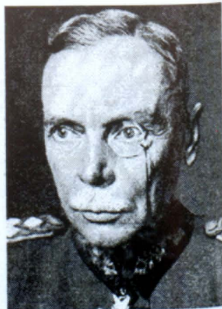
Հանս ֆոն Սեկտ

պատվիրակութեան և կը շարունակէին խօսքերով յորդորել հայերը, իսկ «թուրք մամուլը շարունակ կը խօսէր հայկական խնդրի հաշուեյարդարութեան» 48* մասին և կը հիմնուէին այն բանի վրայ, որ իրենք Հայաստան ստեղծեցին, ուստի և խնդիրը լուծուած էր: Բայց եղաւ և ժամանակ, երբ թուրքերն այլևս իրենց արտայայտութիւններու մէջ իսկ դադրեցան հաշի առնել հայերը և էնվերը ուղղակի ըսեր էր. «եղէք մեզի հետ կամ մենք կը լինենք ձեր դէմ»: 49*