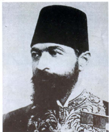
Ահմեդ Իզզեթ փաշա