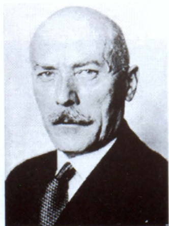
Վերներ ֆոն Շուլցենբուրգ