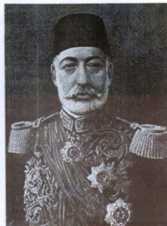
Մեհմեդ 5-րդ Սուլթան