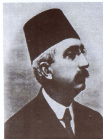
Մեհմեդ 6-րդ Սուլթան