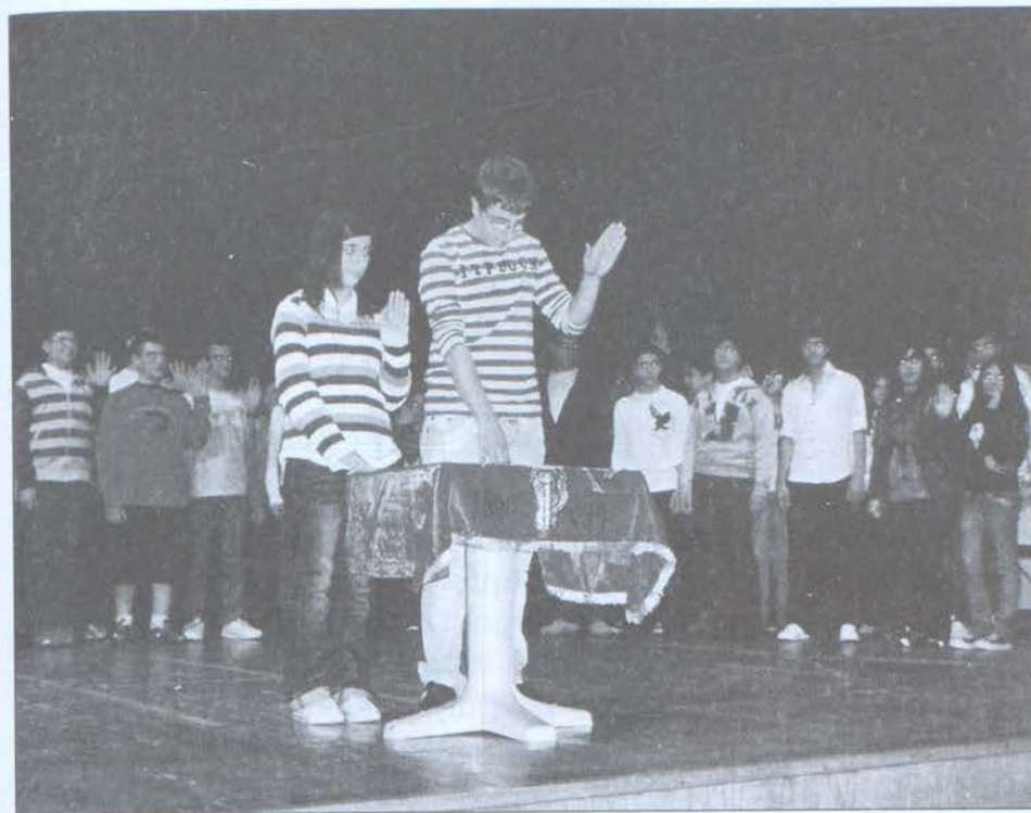
Անմահանուն «Արամ Մանուկեանի սերունդին» Պատգամ փոխանցող՝ Յ. Է. (Մահուան 90-րդ տարելիցին առիթով) Պուրճ Համուտ՝ 20 Նոյ. 2009