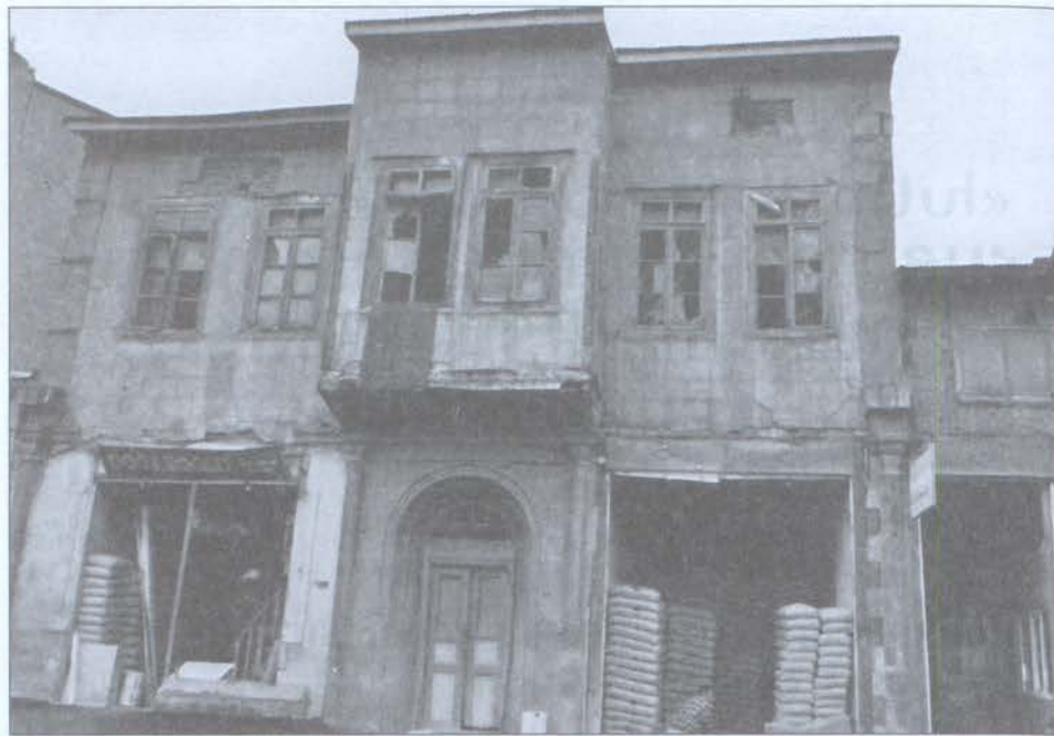
Երզրումի Դաշնակցութեան երբեմնի «ժողովրդային Տուն»ը