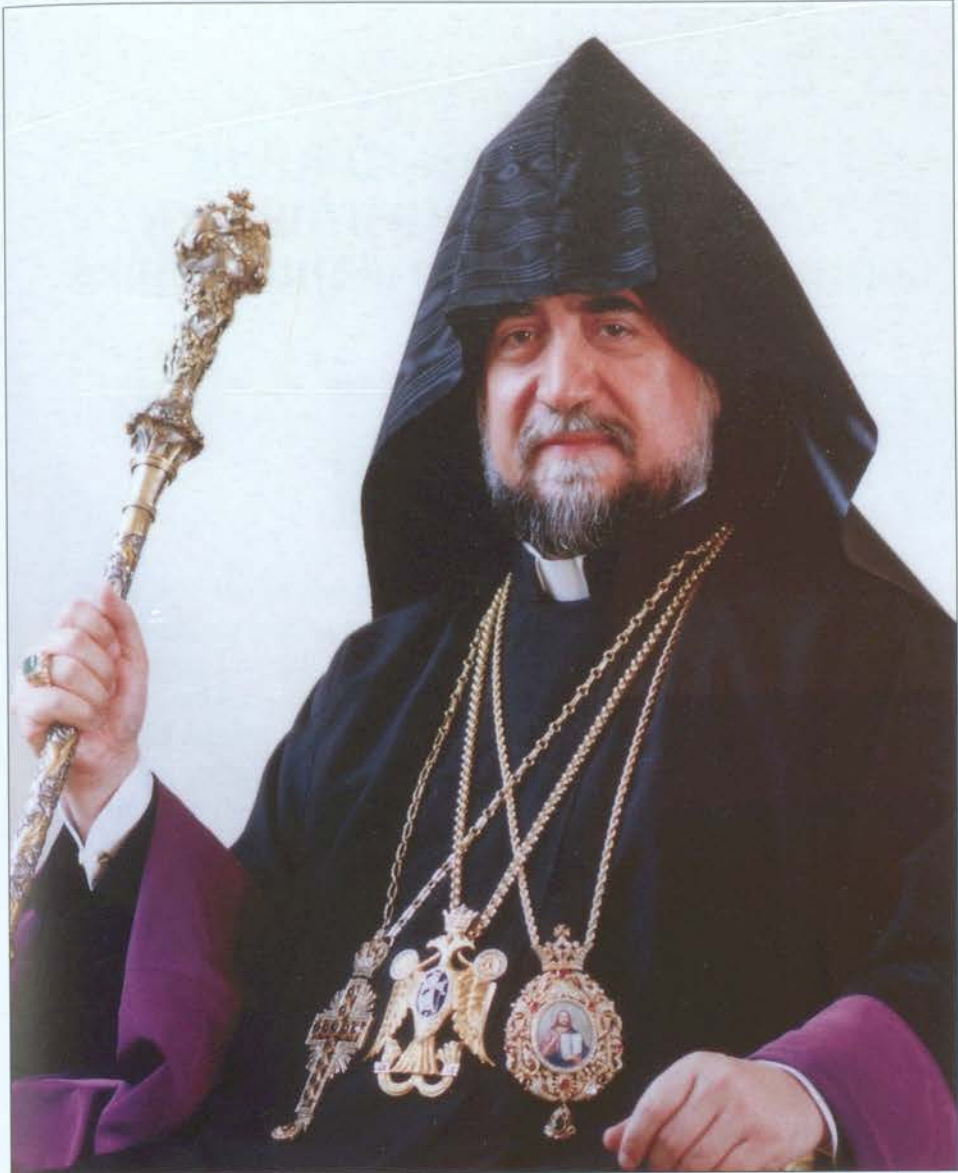
Ա. Ս. Օ. Տ. Տ. ԱՐԱՍ Ա. ԿԱԹՈՂԻԿՈՍ ՄԵՐԱ ՏԱՆՆ ԿԻԼԻԿԻՍ