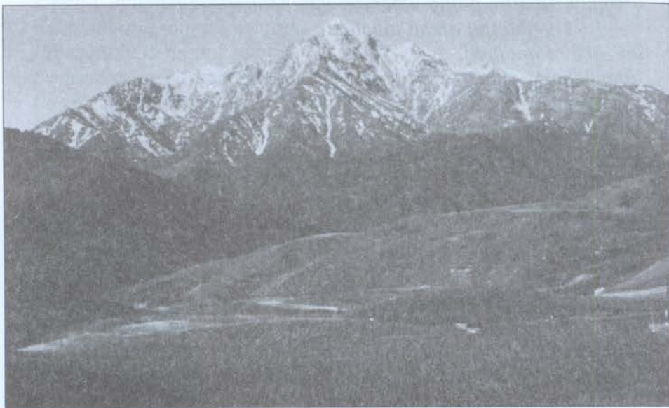
Մռաւ լեռան բարձունքէն Արծուաբիբ ճախրանքով Արցախին հսկող՝ ցեղակրօն հերոս, անսինջ Գարեգին Նժդեհ

Անունը պայծառ, Փաշա կոչումով ՌՌԻԲԷՆ ՄԻՆԱՍԵԱՆ: