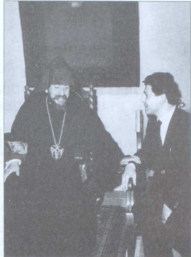
Վեհափառ Խորեն կաթողիկոսին մտերմութեանը մէջ